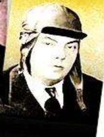
Antoine de Saint- Exupery