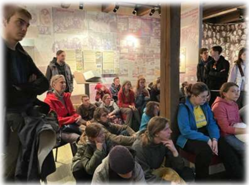
В музее Соловецкого лагеря особого назначения (СЛОН)

Тыль - деревенские дома - «буханка» - экскурсбюро - наконец, пришли! Тучи сменились палящим северным солнцем, подул морской ветер, стала по-настоящему ощутима свобода, а ты просто глядишь вдаль на перекаты волн.