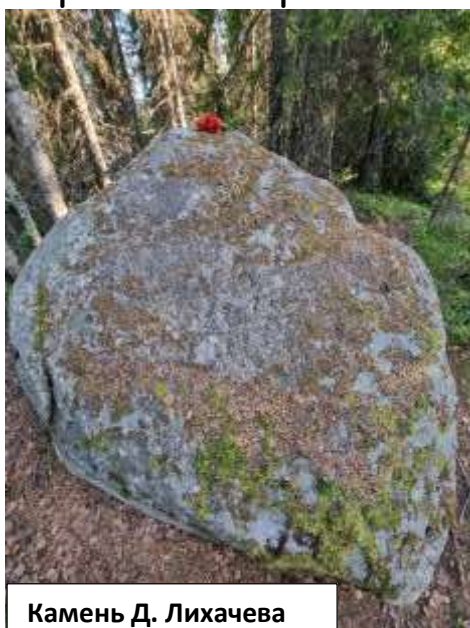
Камень Д. Лихачева

Пеший марш-бросок на Муксалму и обратно (20 км.), под комариный писк, с преодолением болот - чтобы увидеть смелое и прочное творение монахов - дамбу, соединяющую два острова.