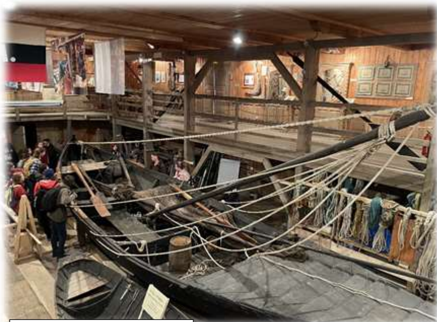
Бот в музее мореходства

Также меня поразил музей Северного мореходства. Невероятно видеть маленький мирок учёных, одержимых мечтой возродить древнее кораблестроение! Мне было очень интересно узнать о методах строительства поморских народов, о