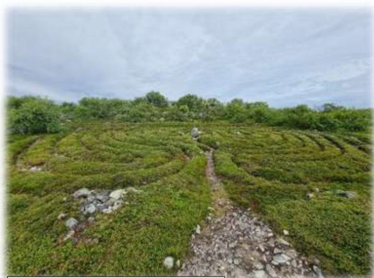
Лабиринты на Заяцком острове

А какой удивительный в этих местах растительный мир! Если вокруг монастыря и почти на всей территории Большого Соловецкого острова пейзажи напоминают привычные нам, то на меньших островах: Муксалмах, Заяцких - уже начинается лесотундра с удивительными полями из