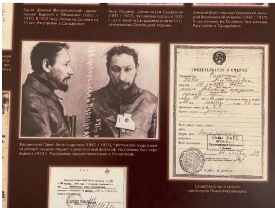
Павел Александрович Флоренский 1882-1937, протоиерей, выдающийся ученый-энциклопедист и религиозный философ

Далее истории попадания людей на один и тот же остров Соловки весьма сложно соотносятся друг с другом. Исторически люди попадали сюда по воле Божьей, как монахи Зосима, Савватий и Герман, потом заключённые ссылались сюда же по воле «того, кто знает, как надо». А современные люди попадают на Соловки, как мне кажется, потому что любят - любят историю, культуру, человека.