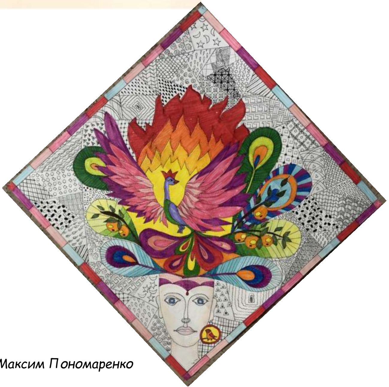
рис. Максим Пономаренко