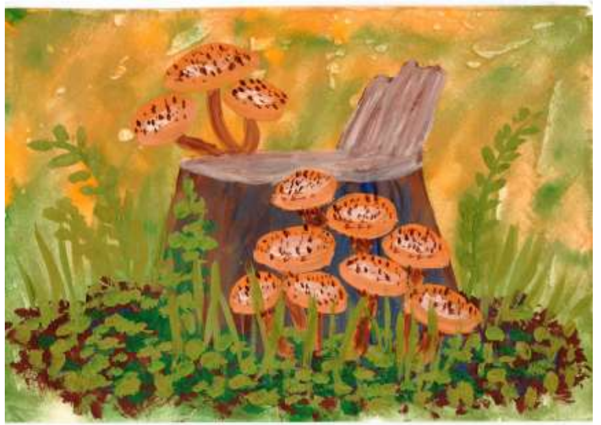
рис. Елизавета Асоян