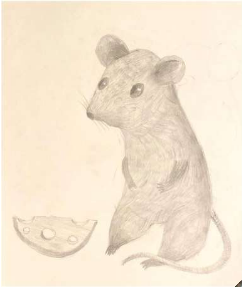
рис. Ника Тарасова