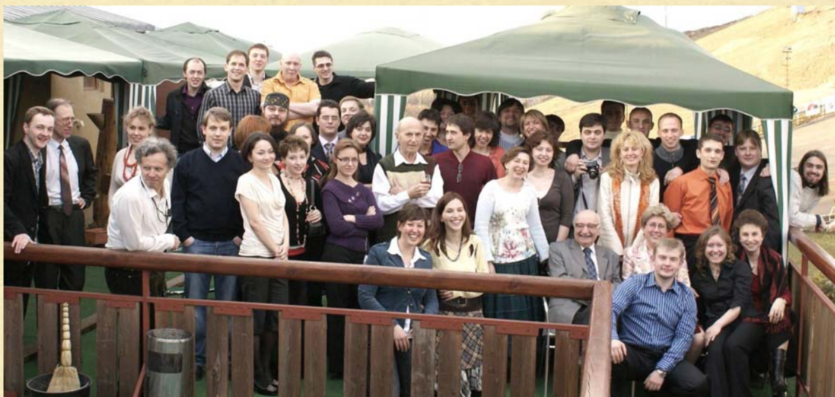
ДЕСЯТИЛЕТИЕ ВЫПУСКА. 2007 год.