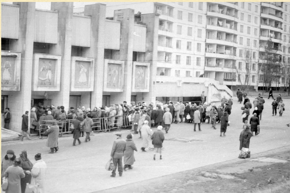
Очередь в «Польскую моду», 1992 год.