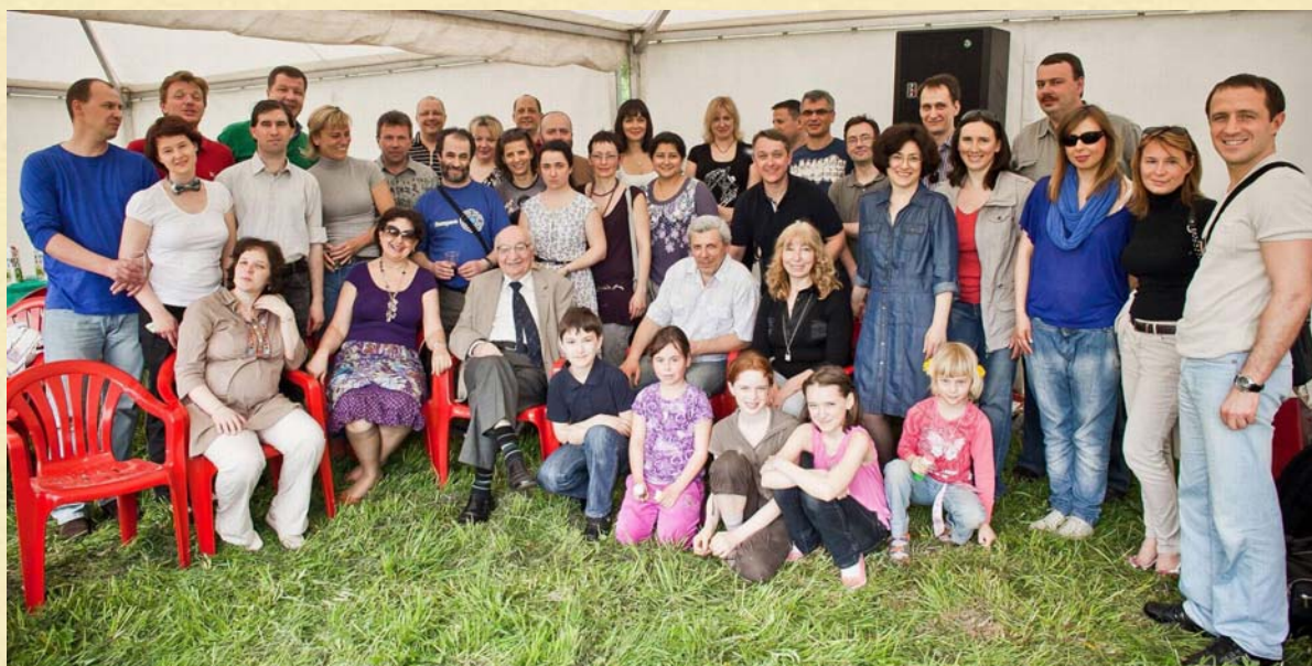
ВСТРЕЧА 2011 ГОДА