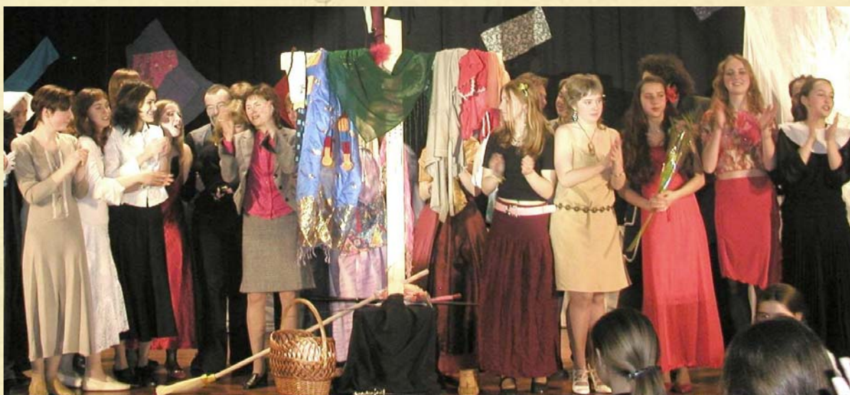
«ТИЛЬ УЛЕНШПИГЕЛЬ», 2005 год.