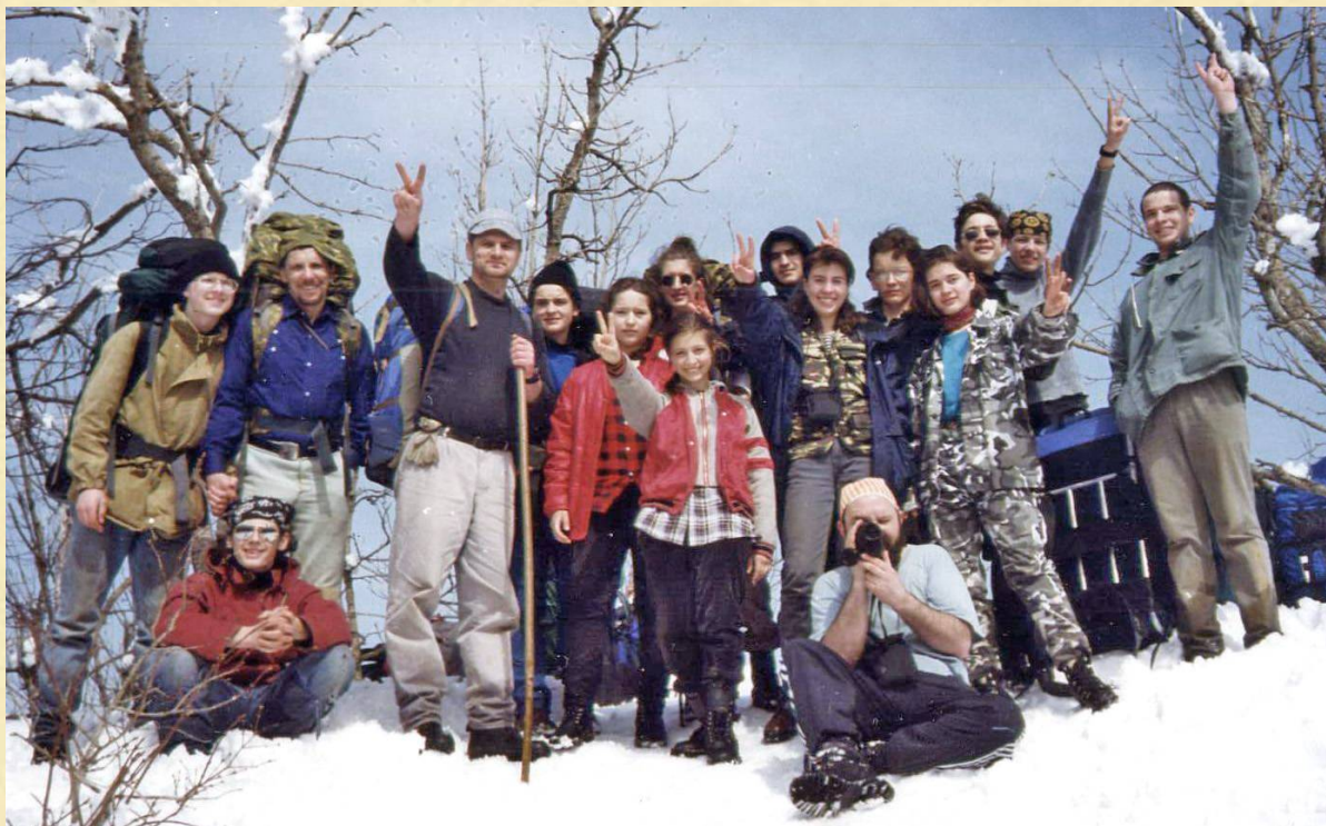
КАВКАЗ, ВЕРШИНА ГОРЫ ТХАБ, МАРТ 1998