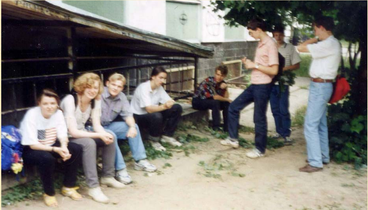
Школьный уголок. Середина девяностых