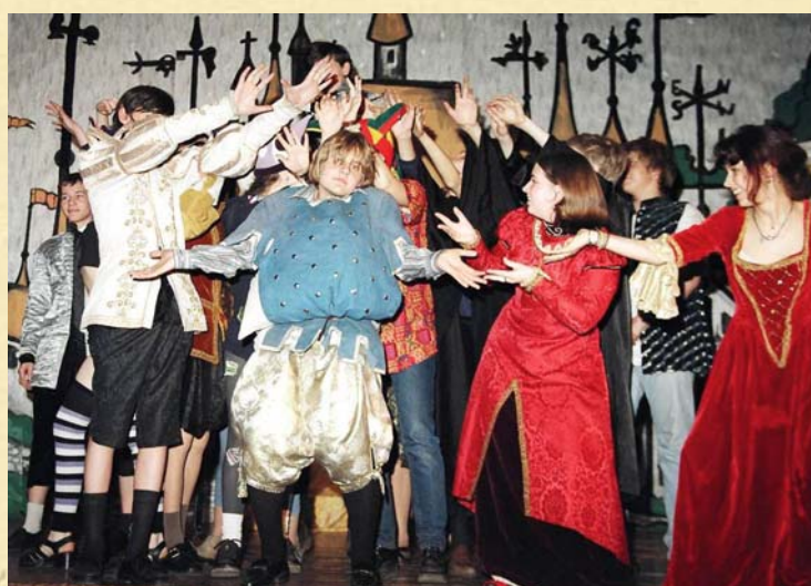
«ВИНДЗОРСКИЕ НАСМЕШНИЦЫ», 1998 год.