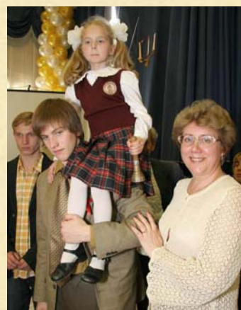
Последний звонок, 2006 год.