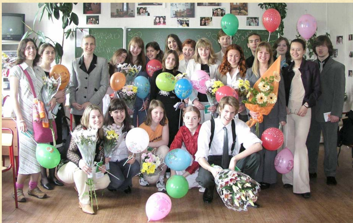
Гуманитарный класс. Последний звонок 2004 г.