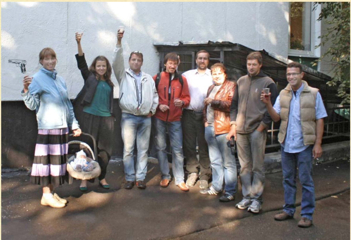
Школьный уголок. Пятнадцать лет спустя.