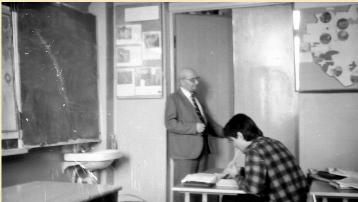
Урок географии в 43 школе, 1992 год.