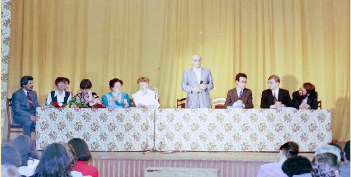
Выпускной вечер 1994 года.