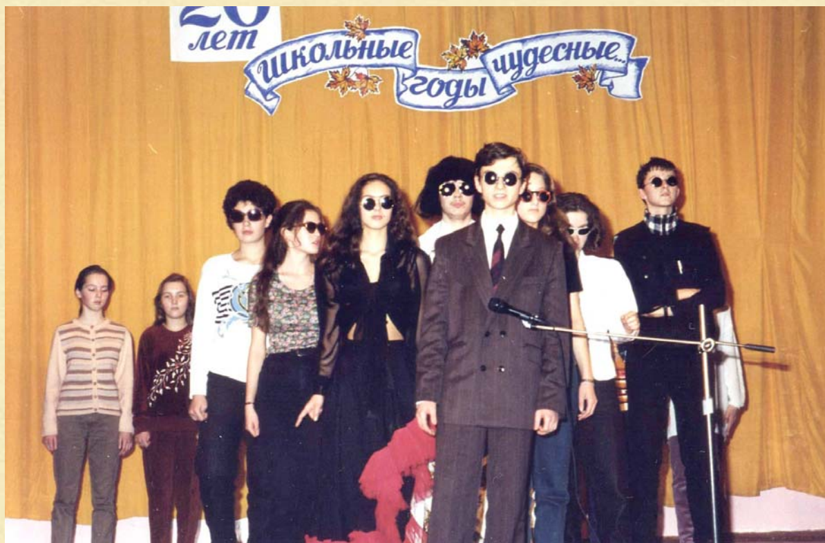
ОДИННАДЦАТИКЛАССНИКИ НА 20-ЛЕТИИ ШКОЛЫ