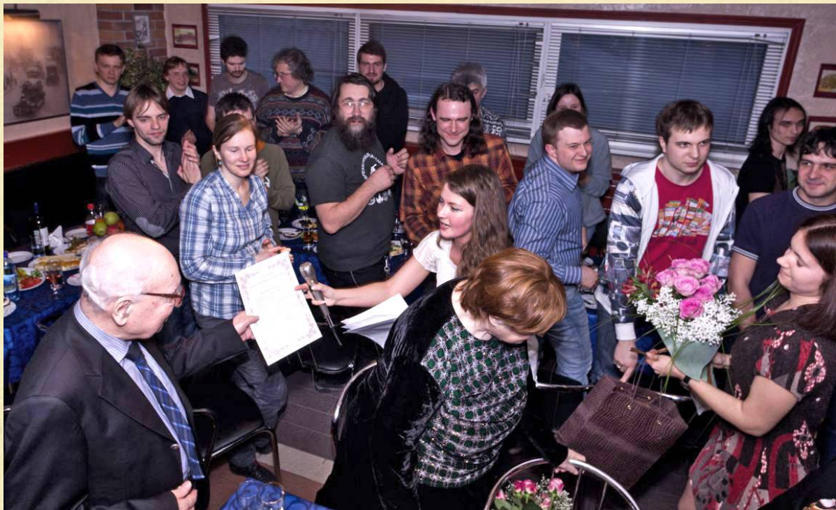
ДЕСЯТИЛЕТИЕ ВЫПУСКА. 2011 год.