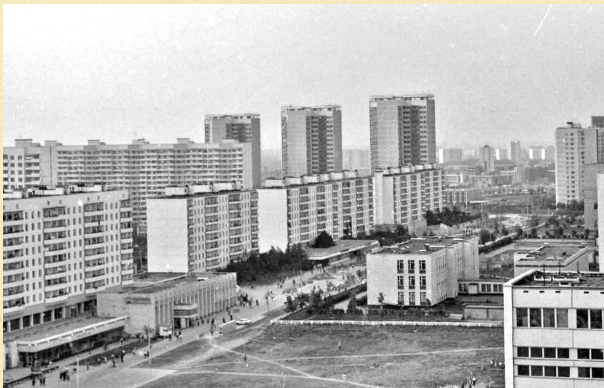
Район 43 школы конца семидесятых

Всегда Ваш, Вадим Заиков 1977 год выпуска