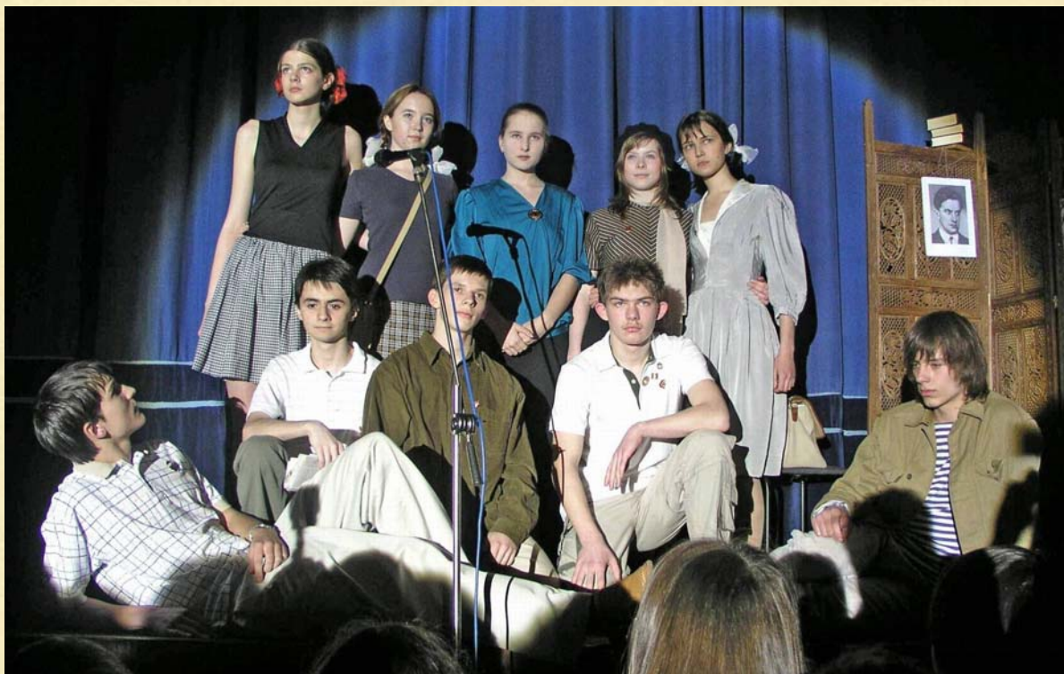
«ЗАВТРА БЫЛА ВОЙНА», 2005 год.