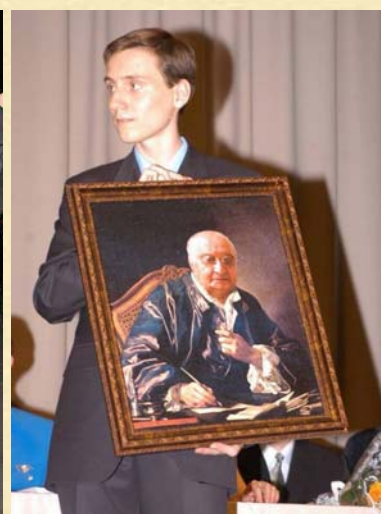
ВЫПУСКНОЙ 2005 года.