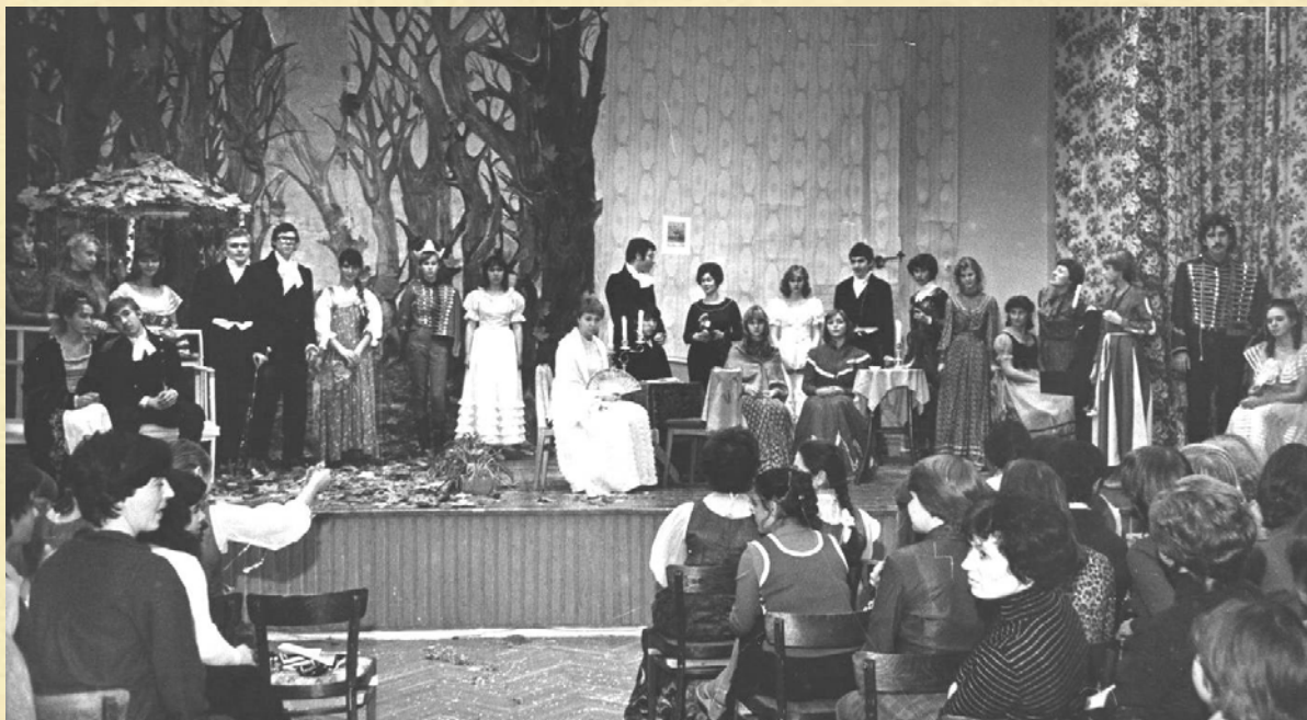
«Дни поздней осени». Спектакль 1981 года